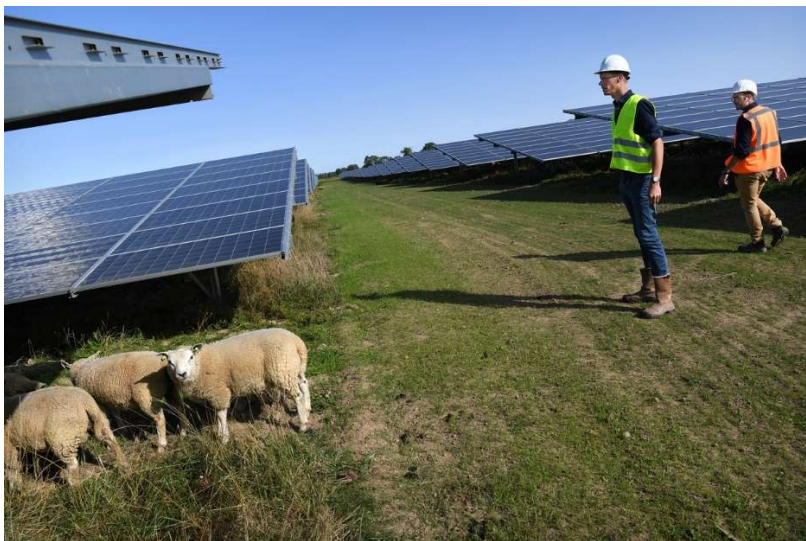
Zonneakker Voorst, het grootste particuliere zonnepark van Nederland, in 2020.